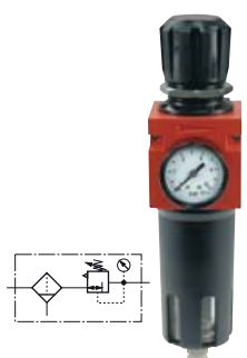
Regulátory tlaku s filtrem FDM, kovové

Manometr není součástí dodávky, objednávejte samostatně!