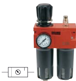
Úpravné jednotky 2-dílné WE, kovové