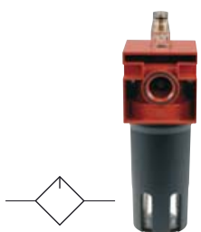
Olejoavače N, kovové