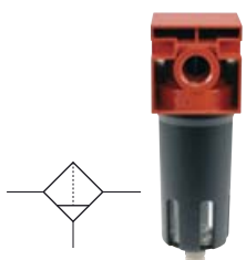
Filtry FWA, kovové

Manometr není součástí dodávky, objednávejte samostatně!