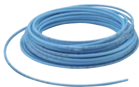
Trubky z grilamidu PA12 - balení v rolích