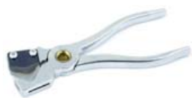
Kleště na trubky